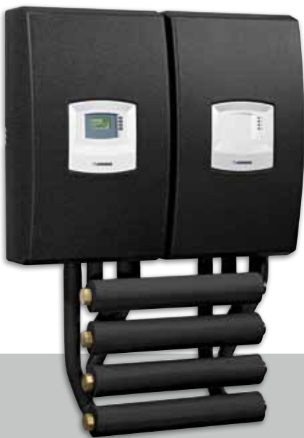
Frischwasserstation LSS-TF 80

Die hygienische Warmwasserbereitung im wirtschaftlichen Durchflussprinzip setzt sich auch für Mehrfamilienhäuser, kleinere Hotels, Pflegeheime und Sportstätten immer mehr durch. Die Vorteile: Keine aufwändige Warmwasserbevorratung, denn das Wasser wird erst dann erwärmt, wenn es auch tatsächlich gebraucht wird. Zudem wird schädliches Legionellenwachstum unterbunden. Sie eignen sich für die Kombination mit Solaranlagen, Wärmepumpen oder Festbrennstoffkesseln.