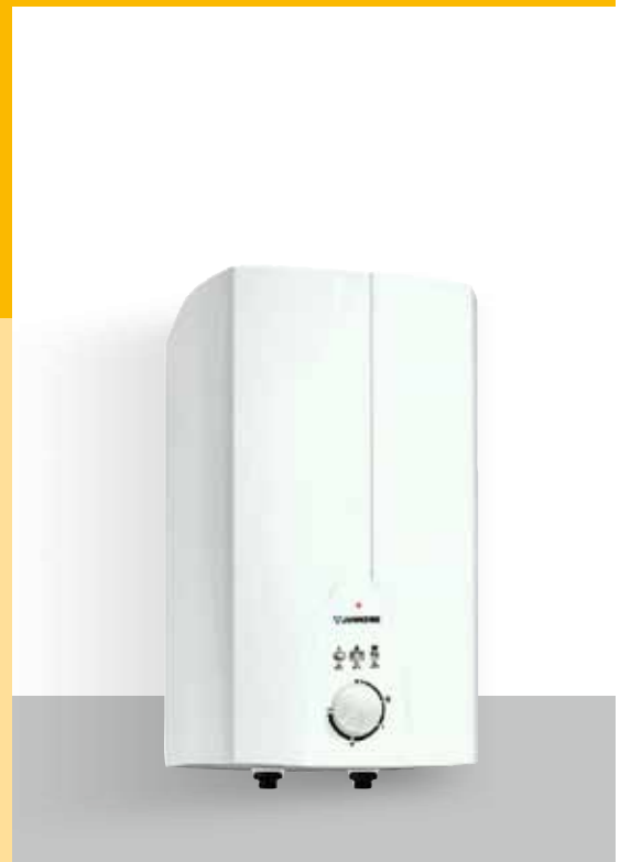
ELACELL Kleinspeicher ENU/O 5-3