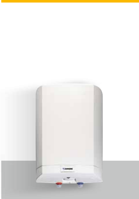
ELACELL Kleinspeicher EHU/O ..-1